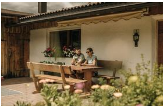
Foto (download): Außergewöhnlich ist bei vielen Hütten rund ums Südtiroler Naturhotel Leitlhof in Innichen/Dolomiten nicht nur die Lage, sondern auch die Küche.

Zu Gast beim Fernsehkoch. Kastanien-Tagliolini mit Ragout von der einheimischen Gams und zum Dessert Fichtenhonig-Parfait an Hagebutte und Schokocrumble: In der Jora Hütte in den Sextner Dolomiten wird der Aufstieg mehr als belohnt. Dabei hält sich die Anstrengung in Grenzen: Gäste des Naturhotel Leitlhof in Innichen erreichen die auf 1.325 Metern gelegene Hütte in gut eineinhalb Stunden. Die kreative Küche, die übrigens auch Südtiroler Klassiker wie Rindersuppe und Marende