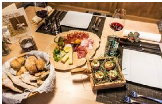
Foto (download): Die Wanderung vom Naturhotel Leitlhof zur Jora Hütte in den Südtiroler Dolomiten wird mit einem Platz an der Sonne sowie exzellenter Küche belohnt.

Urig und unverfälscht. Mit der Blüte der Herbstzeitlose stellt sich die Natur rund um die Sextner Lärchenwiesen auf den bevorstehenden Winter ein. Vorher erfreuen sich Wanderer an der goldenen Jahreszeit, wenn sie das Südtiroler Fischleintal mit seinen tiefen Wäldern, markanten Felswänden und weiten Almen durchschreiten. Unter diesen sticht besonders die Talschlusshütte hervor. In der holzvertäfelten Stube oder auf der Terrasse mit Blick auf die Sextner Dolomiten