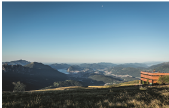
Foto: (download): 2020 eröffnete der Schweizer Alpen Club die renovierte Piansecco-Hütte im schneesicheren Tessiner Bedrettal.