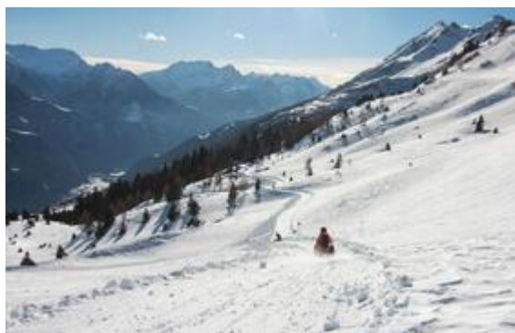
Foto: (download): Nahe der Capanna Gorda im Tessin steht ein beheiztes GAIA, aus dem Wintergäste vom Bett aus in den Nachthimmel sehen können. Bildnachweis: Schweiz Tourismus/Alan Ochsner

dieses zu beheizen, kann man hier auch im Winter übernachten. Der neue Gorda Express, ein vom Schneemobil gezogener Schlitten, bringt die Gäste hoch, runter darf man selber schlitteln oder winterwandern. Dafür gibt es einen neuen sieben Kilometer langen Schneeschuh Trail, der von der Gorda Hütte hinunter nach Camperio führt. ticino.ch/gaia